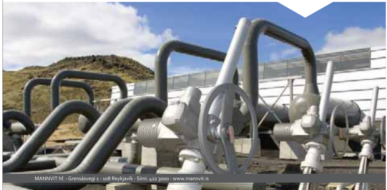
MANNVIT hf. - Grensásvegi 1 - 108 Reykjavík - Sími: 422 3000 - www.mannvit.is

Umsóknir óskast fylltar út á heimasíðu Mannvits, www.mannvit.is .