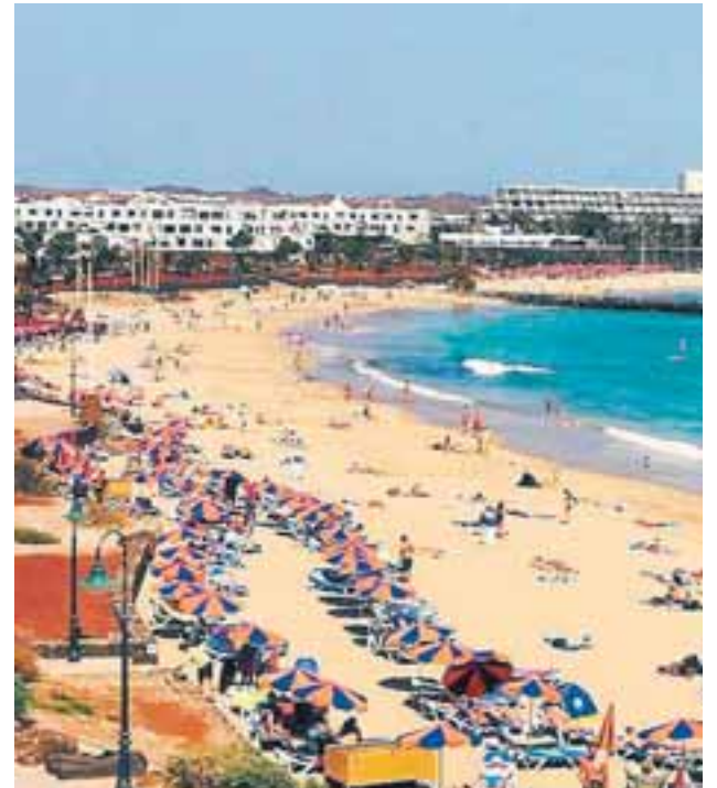
Launafólk er misjafnlega vel að sér um réttindi til orlofs og áherslur stéttarfélaganna í orlofsmálum eru ekki allar þær sömu.