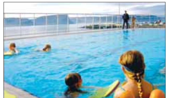
Sundlaugarverðir verða að hafa náð átján ára aldri.